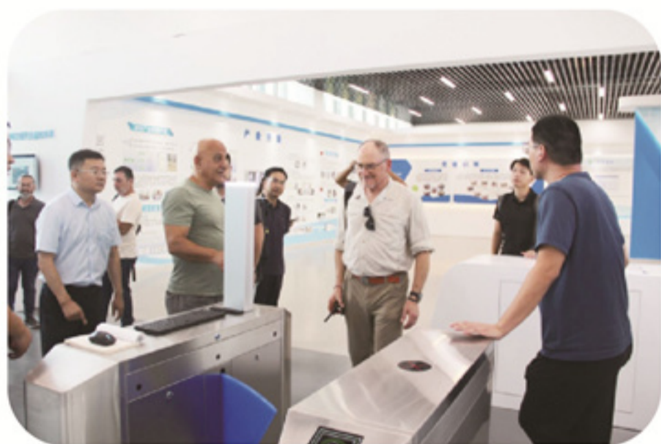
▼ 以色列媒体代表团在龙信集团 工艺工法和智慧工地展示馆体验

媒体代表团随后参观了龙信聚贤新村项目和江湾壹号项目。这两个项目，充分体现了龙信集团在设计、施工、建造方面的强大实力与组织实施能力。媒体团对聚贤新村项目智慧建造、安全防护措施落实、扬尘管控、职工权益保障、龙信工艺工法的实施及现场文明施工表示赞赏。在江湾壹号项目，媒体团对这个高端商业住宅项目进行了全面的了解，并参观了工艺工法样板间、实景交付样板间、小区公共区域、地下停车库、健身休闲会所等示范区域，得到了媒体团成员们的交口称赞。