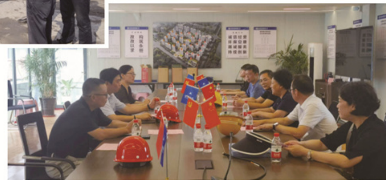
海门聚贤项目慰问现场