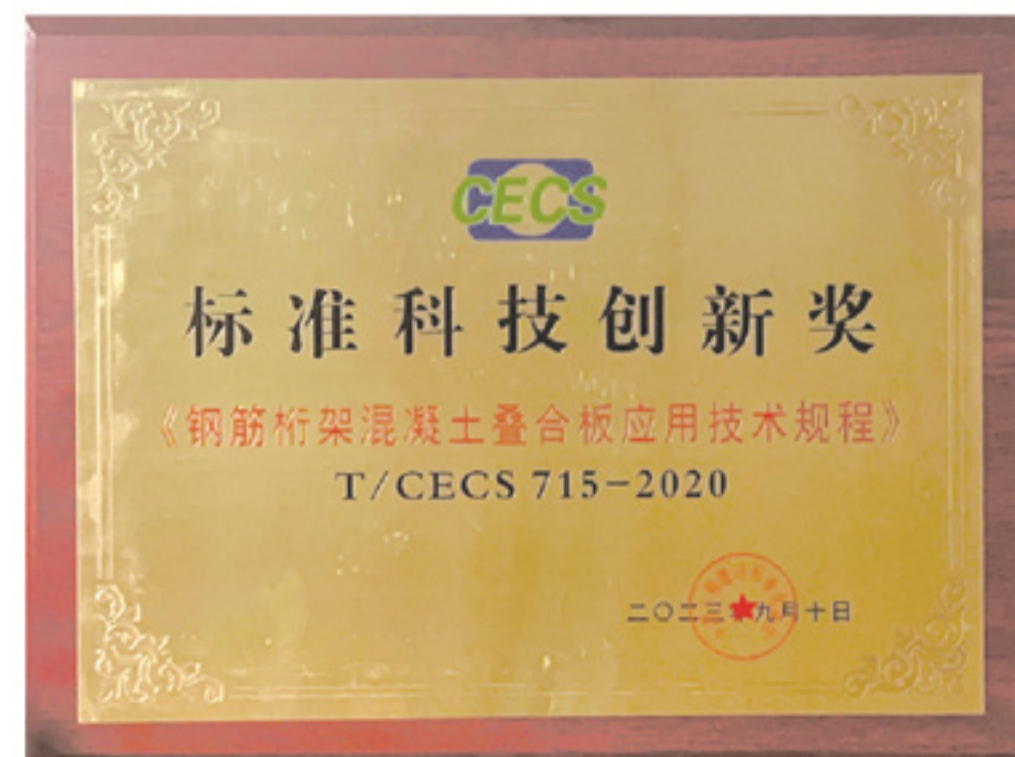
《钢筋桁架混凝土叠合板应用技术规程》 获2023年度标准科技创新奖项目奖一等奖