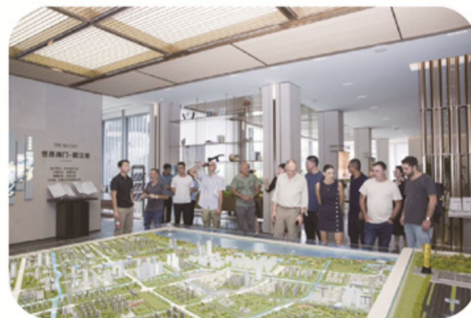
以色列媒体代表团在海门聚贤新村项目调研 ▶

媒体代表团随后参观了龙信聚贤新村项目和江湾壹号项目。这两个项目，充分体现了龙信集团在设计、施工、建造方面的强大实力与组织实施能力。媒体团对聚贤新村项目智慧建造、安全防护措施落实、扬尘管控、职工权益保障、龙信工艺工法的实施及现场文明施工表示赞赏。在江湾壹号项目，媒体团对这个高端商业住宅项目进行了全面的了解，并参观了工艺工法样板间、实景交付样板间、小区公共区域、地下停车库、健身休闲会所等示范区域，得到了媒体团成员们的交口称赞。